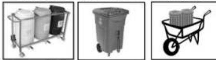
Gambar 1. Contoh Alat Angkut/Troli Pengangkut Limbah