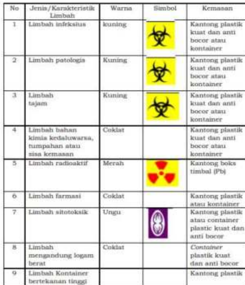
Tabel 27. Jenis/Karakteristik Limbah, Warna, Simbol, dan Kemasan Limbah B3